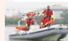
soccorso in acqua