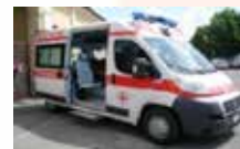
soccorso con ambulanza